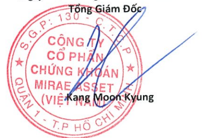
Kang Moon Kyung